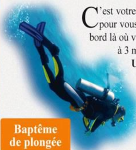
Baptême de plongée

C'est votre première immersion en scaphandre, vous avez une légère appréhension, ce baptême est fait pour vous. Avec un moniteur confirmé, vous vous immergerez le long d'un sec rocheux en partant du bord là où vous avez pied. La plongée se fera progressivement à votre rythme et en toute sécurité jusqu'à 3 mètres de fond.